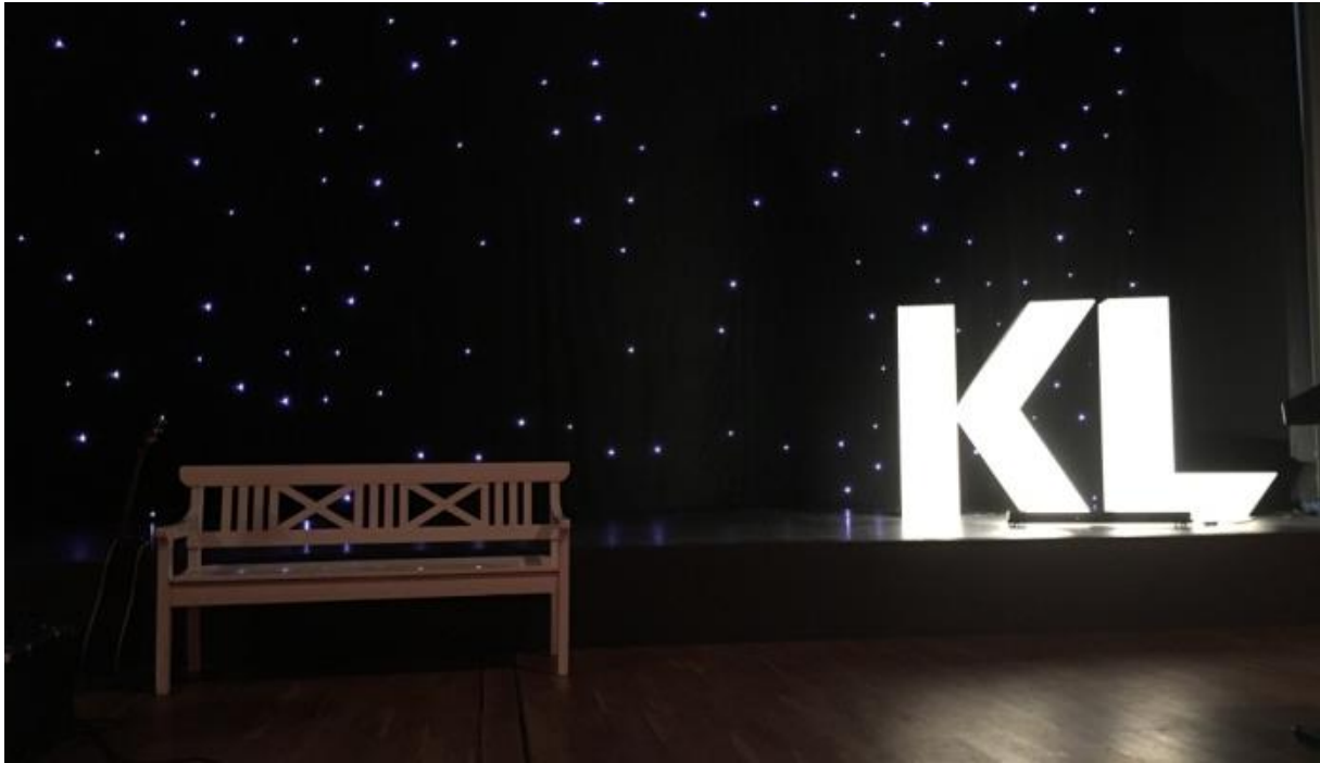
Scenen i kongressalen